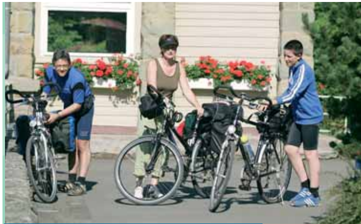
Zu Wasser und zu Land